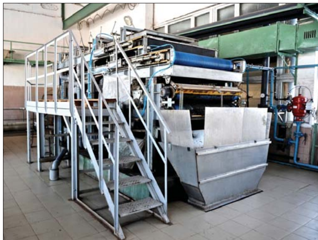
Рис. 9. Ленточный фильтр-пресс ЛФ-1800П

После реконструкции (2012–2013 годы) очищенная вода на выходе с очистных сооружений характеризовалась следующими показателями: взвешенные вещества 5–8 мг/л (ПДК 10 мг/л); БПК 5 2,3–2,5 мг/л (ПДК 2 мг/л); азот аммонийный 0,28–0,32 мг/л (ПДК 0,4 мг/л); азот нитратный 9–12 мг/л (ПДК 9,1 мг/л). Эффективность очистки составила: по взвешенным веществам 97%; по БПК 95–98%; по азоту аммонийному 98–99%; по азоту нитратному 40%.