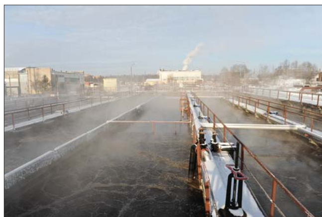
Рис. 4. Очистные сооружения г. Истры

В настоящее время очистные сооружения принимают хозяйственно-бытовые стоки с застроенных территорий города и прилегающих поселков, а также производственные сточные воды следующих предприятий: ОАО «Детское питание «Истра-Нутриция», ООО «КРКА-РУС», ОАО Истринский опытный завод «Углемаш», ОАО «Проектно-строительное объединение № 13», ООО «Истринское ДРСУ» и др. Подача стоков в приемную камеру очистных сооруже-