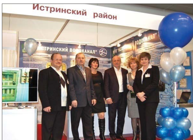
Рис. 2. Коллектив Истринского водоканала на выставке