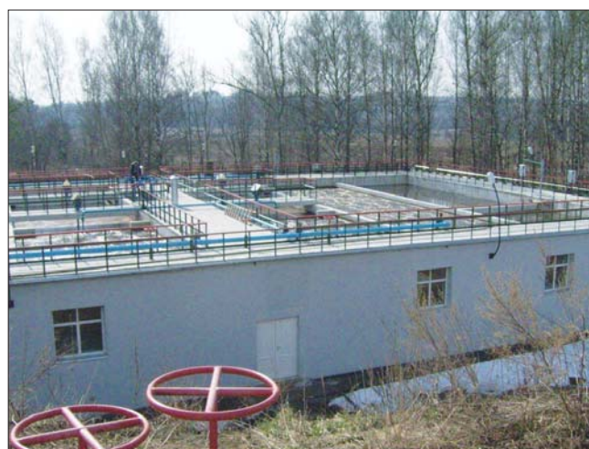
Рис. 10. Блок биологической очистки, размещенный в здании биофильтров на очистных сооружениях ФГУ «Дом отдыха «Снегири» УДП РФ

В 2006 г. был разработан проект реконструкции очистных сооружений канализации дома отдыха «Снегири». В 2008 г. реконструкция была завершена (заказчиком работы являлся ФГУ «Дом отдыха «Снегири» УДП РФ). Дом отдыха находится в 20 км к западу от Москвы на берегу реки Истры. Площадка очистных сооружений расположена близко к территории дома отдыха, в 440 м от реки. Интересным техническим решением при реконструкции сооружений оказалось устройство блока биологической очистки с использованием здания биофильтров и двух секций капельных биофильтров (рис. 10). В соответствии с проектом, каждая секция блока биологической очистки разделена перегородками на три коридора, в которых выделены четыре зоны: анаэробная, аноксидная, нитрификации и сепарации иловой смеси.