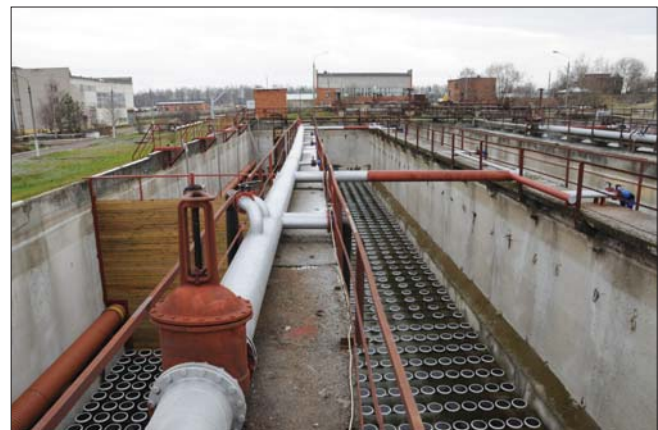
Рис. 6. Реконструкция аэротенков с использованием в зонах нитрификации мелкопузырчатых мембранных аэраторов компании SSI

Для перемешивания иловой смеси в аноксидной зоне установлены мешалки фирмы Grundfos (Дания). Для перекачки возвратного активного ила из вторичных отстойников и для их опорожнения вместо эрлифтов предусмотрены погружные насосы с целью предотвращения попадания кислорода в зону денитрификации и сокращения расхода воздуха на эрлифты. В горизонтальных вторичных отстойниках установлены скребковые механизмы компании MEVA (Швеция), пла-