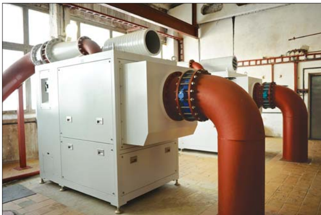
Рис. 7. Воздуходувки NX-300 фирмы Neuros