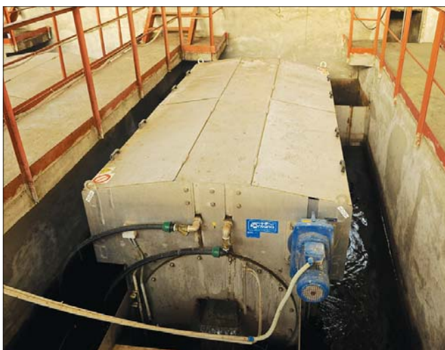
Рис. 8. Микросетчатый фильтр MFB-220

вающие вещества задерживаются механизмом производства фирмы «БИФАР».