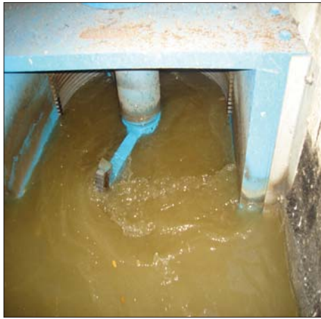
Рис. 5. Решетки-измельчители (димминуторы) фирмы Franklin Miller

ний осуществляется местными канализационными насосными станциями.